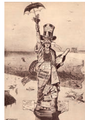
Karikatura iz američkog časopisa “Punch” iz 1885. prikazuje budući izgled Kipa Slobode na ulazu u njujoršku luku. Kip je nakićen različitim reklamama. Sve vrijednosti pa i sloboda podređene su komercijalnom interesu.

Jedna od najvećih promjena u načinu na koji moderni čovjek gleda na društvo i svijet oko sebe je široko prihvaćanje ideje jednakosti svih ljudi.